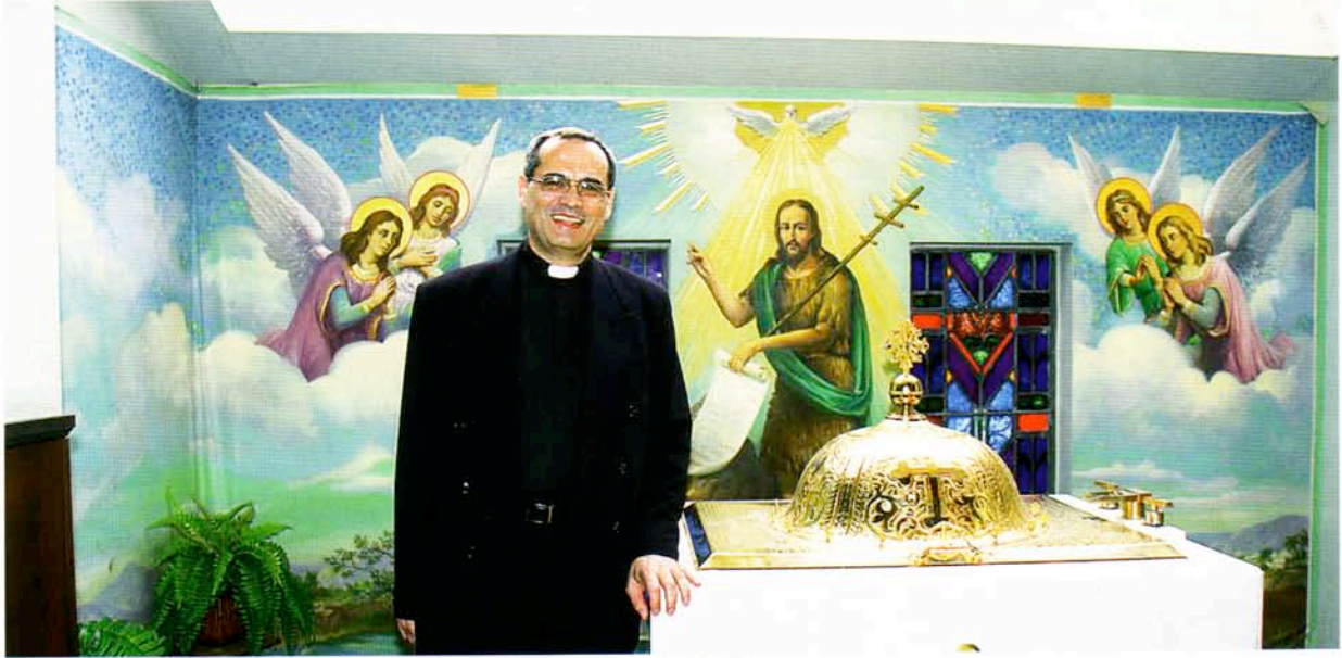
انقل التراث الشرقي