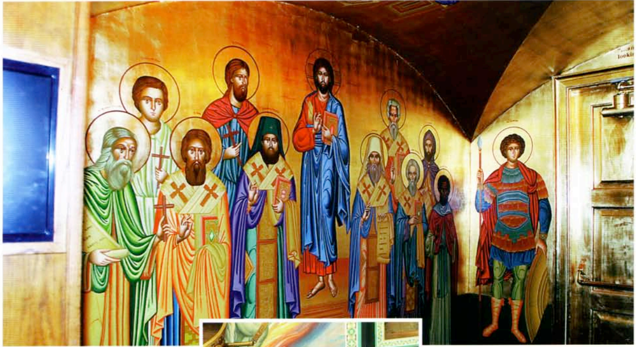
الكاتدرائية تحولت إلى متحف

البارز يوجد فيها مدرسة ابتدائية وبيتاً للمسنين ومخيماً هو بمثابة مركز للمؤتمرات والخلوات الروحية يقع في أعالي الجبال المحيطة ببلوس انجلوس في غابة شبيهة بغابة الأرز اللبنانية.